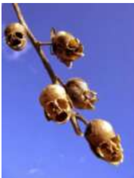
Muflier des champs ou fleur tête de mort (Antirrhinum)