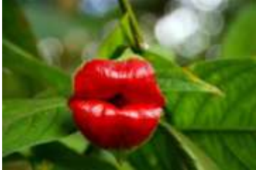
Orchidée : Lèvre de prostituée ou lèvre chaude (Psychotria)